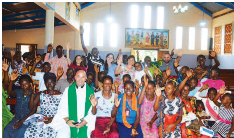
Chiesa di Kiyunga (Uganda)