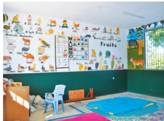
Scuola del S. Cuore Immacolato di Maria (Tanzania)

telo mare, una gonna, una tovaglia, un braccialetto... qualcosa di utile, bello e originale per te, per la tua casa o per regalarlo, cogli l'occasione di acquistarli alla fine della S. Messa della domenica mattina nel periodo di Quaresima oppure chiedi a don Flavio. Dall'Africa abbiamo portato valigie piene di prodotti tipici per sentire e vedere un po' di Africa a Tricase. Tutto il ricavato andrà donato per l'acquisto della strumentazione per la diagnostica all'ospedale Nazareth a Kiambu-Nairobi .