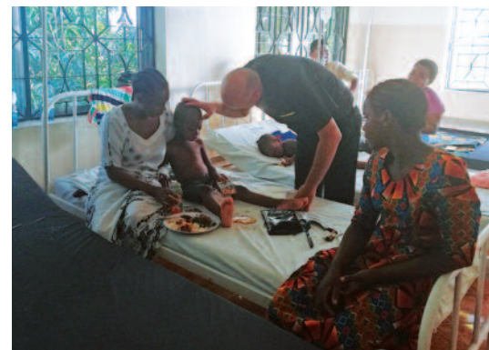
Ospedale di MOYOSAFI WA MARIA (Tanzania)

Se vuoi acquistare un oggetto di legno, un