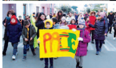
Alcuni momenti della manifestazione

vivere in un mondo in cui ci sono persone che si impegnano ad assicurare ideali e valori di vita importanti e fondamentali, universalmente validi e sempre attuali: l'amore, il rispetto, l'altruismo, la pace.