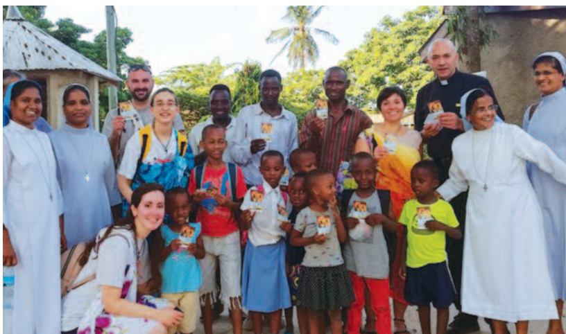
Villaggio Obongo (Tanzania)