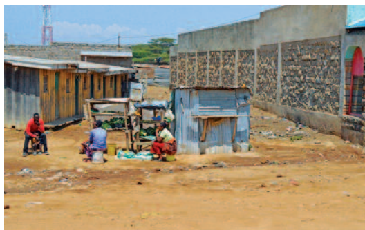
Villaggio Masai (Kenya)